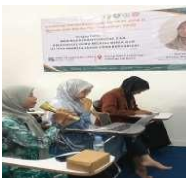
Sesi tanya jawab

Setelah penyampaian materi selesai, dibuka sesi tanya jawab untuk para peserta pelatihan, dan peserta cukup atusias dalam memberikan seputar permasalahan yang terjadi disekolah.