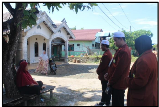
Doc. Sosialisasi Kampus Terhadap Masyarakat Dengan Berkeliling Desa Kuala Tambangan