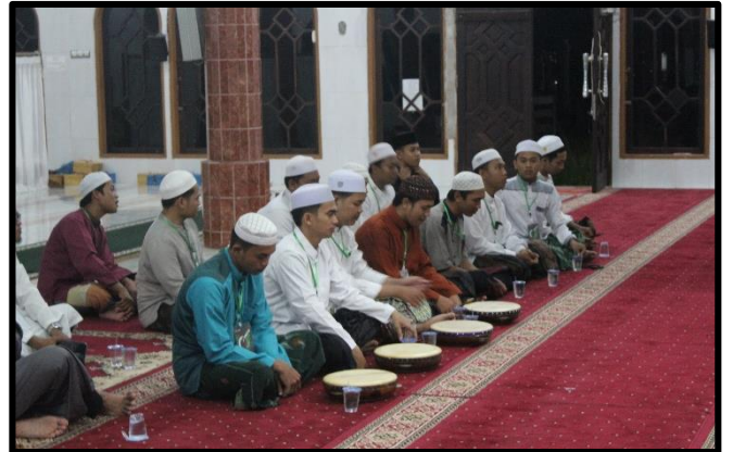
Doc. Pembacaan Maulid Simtudduror Di Mesjid