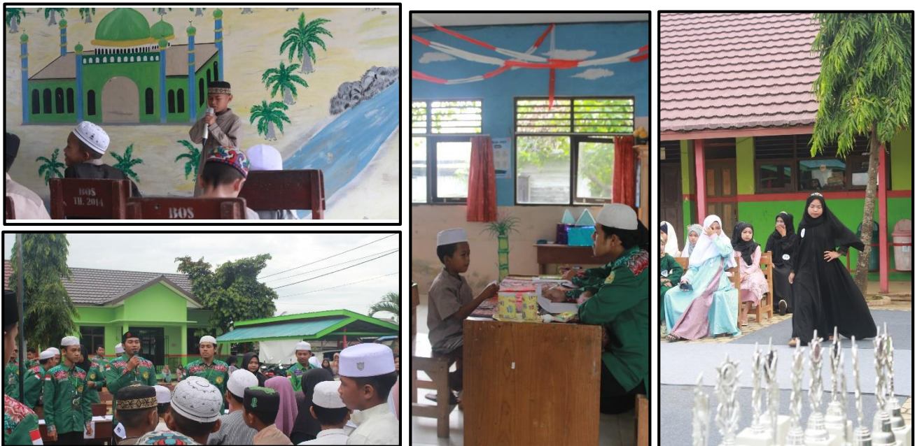
Doc. Acara Lomba Islami (Adzan, Hafalan Surah Pendek A, Hafalan Surah Pendek B, Fashion Show, Dan Unjuk Bakat).

Kami bertujuan untuk menggambarkan pendidikan karakter Islami anak usia dini sesuai dengan fitrah perkembangan, konsep, evaluasi, hambatan dan tantangan pelaksanaan kegiatan. Pengumpulan data melalui observasi, wawancara, dan dokumentasi kemudian dianalisis dengan mereduksi, mendisplay dan memverifikasi. Pendidikan holistik berbasis karakter Islami secara implisit diterapkan TK dan SD dengan konsep pembelajaran sentra dan tematik. Sentra yang tersedia yaitu; Ibadah, bahan alam, rancang bangun, kreasi, main peran, dan persiapan. Karakter yang dibangun adalah; iman dan taqwa, peduli dan empati, cerdas, sabar, kreatif, berani, patuh, dan disiplin. Kemudian evaluasi rutin dilakukan berdasarkan perkembangan kompetensi dasar dan sasaran pengembangan karakter secara menyeluruh berdasarkan fitrah anak yang alami, unik dan berbeda-beda. Hambatan yang dialami sekolah adalah kurangnya kerjasama orang tua dalam mensinergikan pembiasaan di rumah. Dengan pengembangan karakter islami sesuai fitrah anak usia dini, mendidik menjadi mudah karena Allah telah memberikan tahapan perkembangannya, merdeka belajar dan merdeka bermain sesuai minat dan karakteristik menjadi pengalaman menyenangkan.