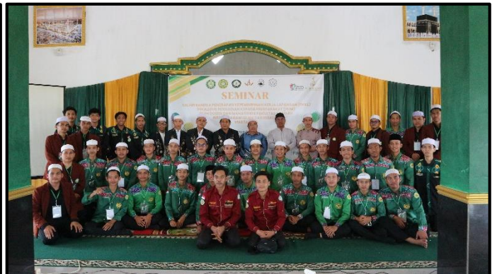
Doc. Foto Bersama Putera Dan Puteri. Peserta Dan Pengurus Acara PKKL 2024