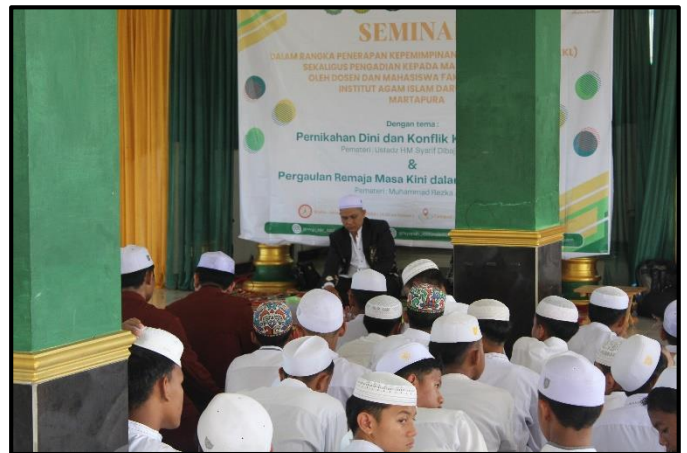
Doc. Seminar Ilmiah Dan Pencerahan Kepada Masyarakat

Adapun kegiatan yang dilaksanakan di ruang induk pondok pesantren al- muttaqin Desa Kuala Tambangan Kecamatan Takisung adalah dengan memberikan Seminar , PKM (Pencerahan Kepada Masyarakat) dan konsultasi hukum kepada masyarakat luas dan anak anak pondok pesantren dengan tema “ pernikahan dini dan konflik keluarga islam”