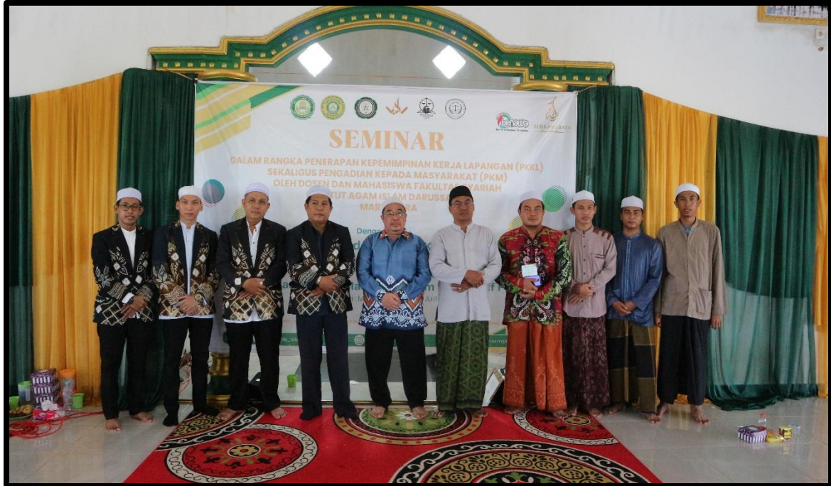
Doc. Foto Bersama Dosen, Pimpinan Serta Dewan Guru Pondok Pesantren AI – Muttaqin, dan Bapak Pembakal