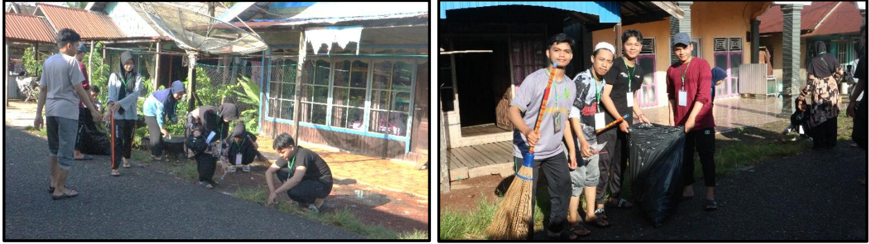
Doc. Gotong Royong Secara Menyeluruh Di Desa Kuala Tambangan