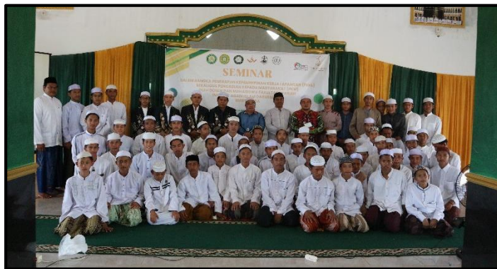
Doc. Foto Bersama Santri Dan Santriwati Pon-Pes AI Muttaqin Desa Kuala Tambangan