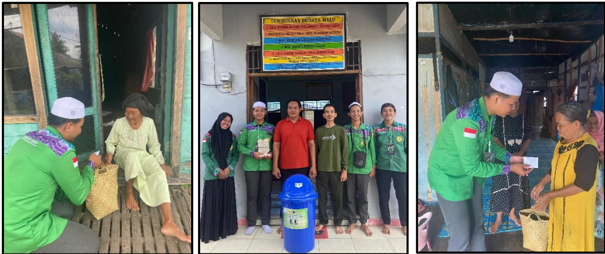
Doc. Bantuan Sosial Kepada Warga Desa Kuala Tambangan