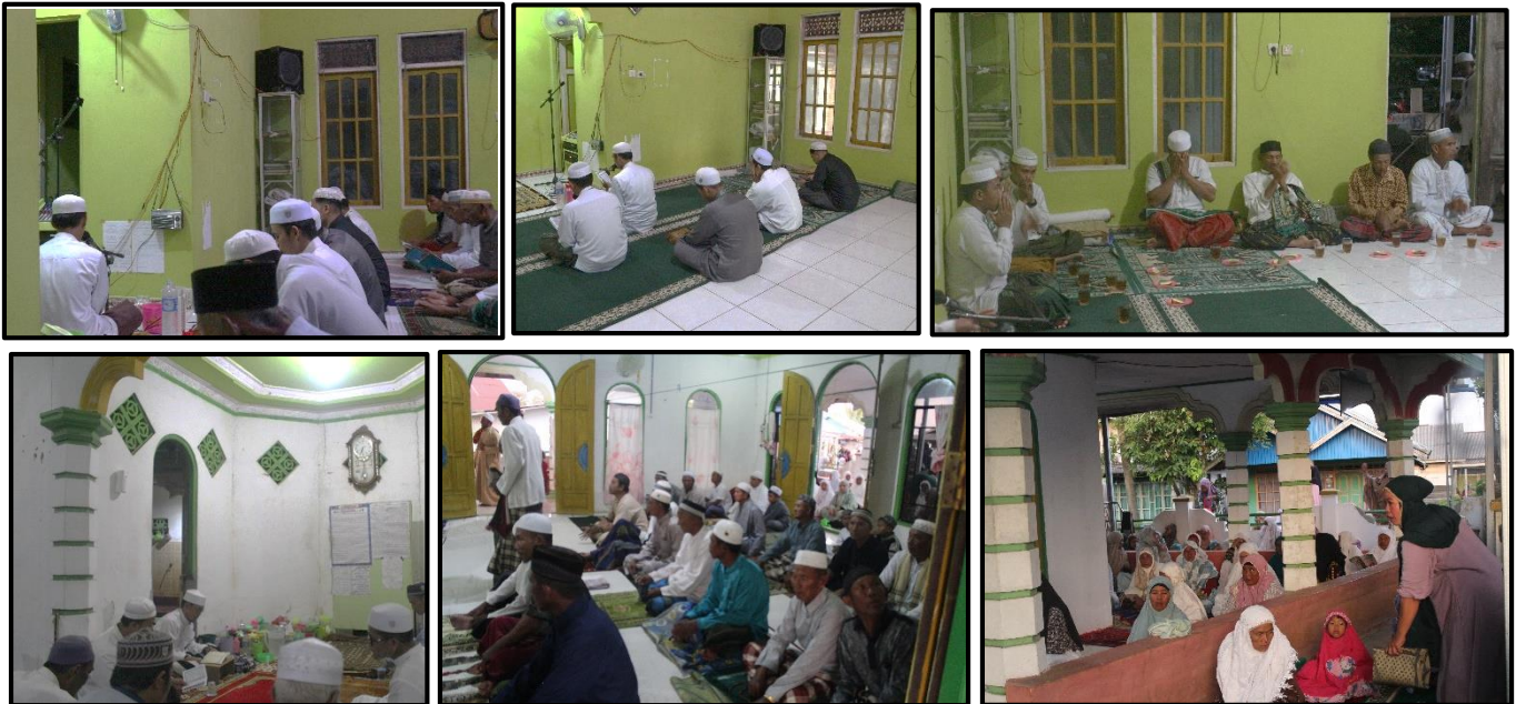
Doc. Kegiatan Malam Nisfu Sya'ban Di Berbagai Langgar Desa Kuala Tambangan

Bertepatan kegiatan pengabdian kami di tanggal 23 – 25 Februari / 13 – 15 Sya'ban kami melaksanakan amaliyah malam nisfu Sya'ban Dilaksanakan di Mesjid dan beberapa Langgar didesa Kuala Tambangan Kecamatan Takisung. Namun dengan kehadiran anggota PKKl maka lebih menambah semangat Masyarakat dengan suasana baru, dengan kehadirannya mahasiswa institut agama islam darussalam di pinta masyarakat untuk memimpin kegiatan amaliyah pada malam hari itu, kegiatan – kegiatannya sebelum sholat magrib kami membaca syair ya hannan ya mannan setelah itu sholat Magrib berjama'ah dan ba'diyah nya dilanjutkan Sholat Sunnah Taubat, Hajat, Tasbih Lalu mmbaca Al-qur'an Surah Yasin sebanyak 3x serta niat dan do'a lanjut Sholat Sholat Isya Berjamaah serta qobliyah dan ba'diyahnya Dan Selesai.