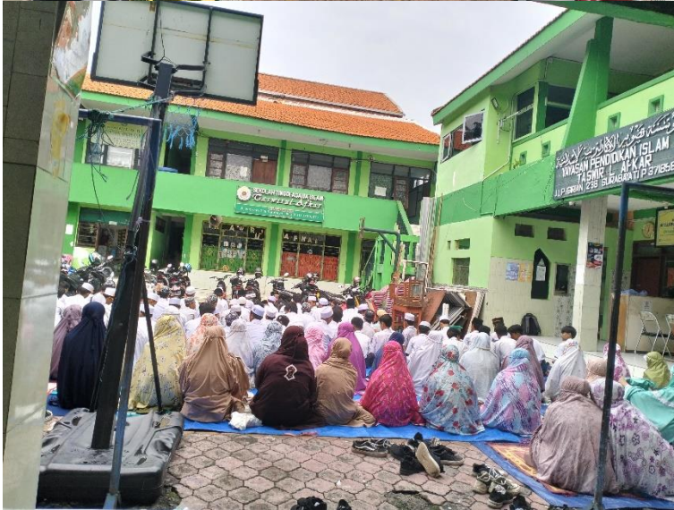
Pendampingan Sholat Dhuha