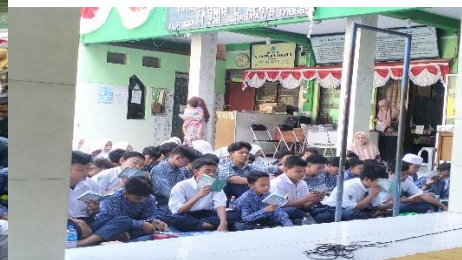
Pendampingan Pembiasaan kirim Doa Bersama Jum' at