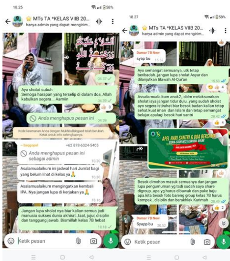
Pesan Lewat WhatsApp Group kelas