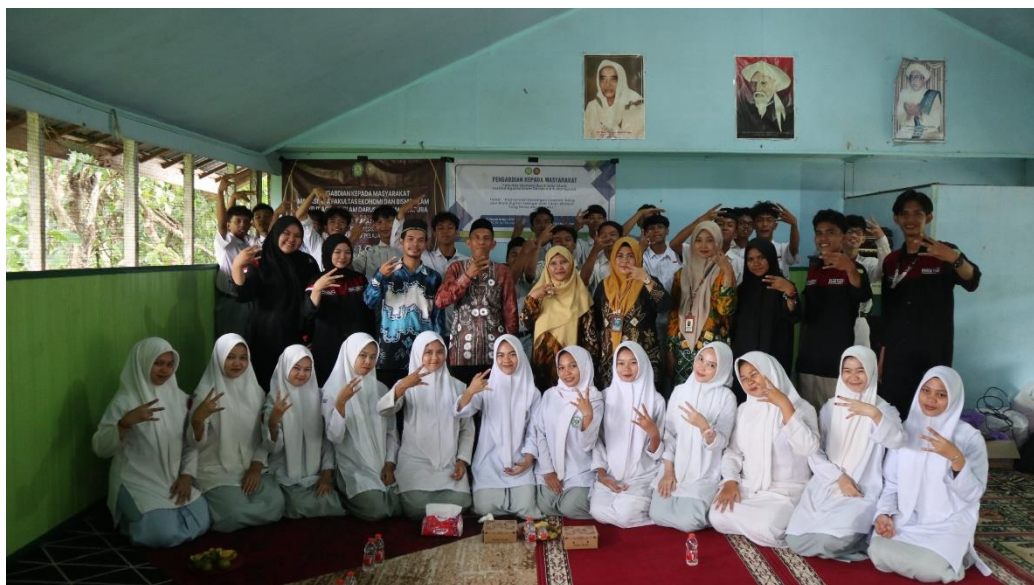
Gambar .4 Foto Bersama Guru dan Siswa-Siswi Mas Al-Irsyad Astambul