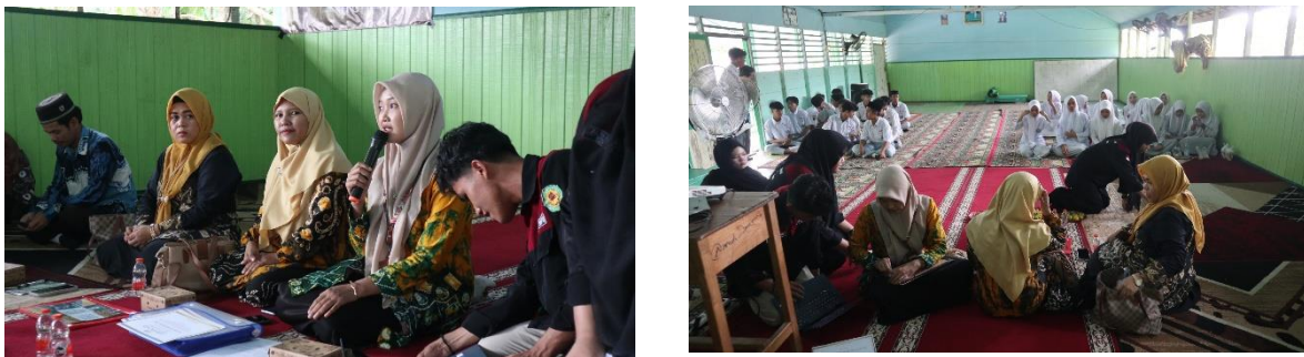
Gambar .2 Persiapan dan Pembukaan Kegiatan Pengabdian Kepada Masyarakat

Sebelum kegiatan dimulai, sebagian besar siswa telah mengenal dan menggunakan sistem pembayaran digital seperti dompet elektronik, QRIS, dan layanan mobile banking . Namun, pemahaman mereka masih terbatas pada aspek kemudahan transaksi dan belum memahami secara mendalam mengenai pengelolaan keuangan serta prinsip-prinsip syariah dalam transaksi digital.