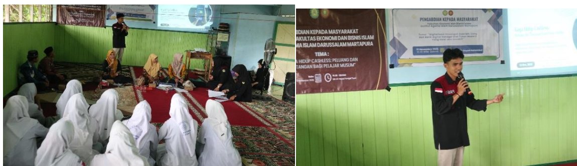
Gambar .3 Penyampaian Materi tentang Peluang dan Tantangan Gaya Hidup Cashless Terhadap Pelajar Muslim

Selama sesi diskusi, siswa menunjukkan ketertarikan terhadap materi yang disampaikan, terutama terkait bahaya perilaku konsumtif dan cara mengelola keuangan pribadi di era digital. Keaktifan siswa dalam bertanya menunjukkan bahwa edukasi mengenai gaya hidup cashless berbasis syariah sangat relevan dengan kondisi kehidupan pelajar saat ini.