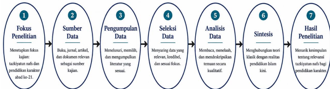
Gambar 1. Alur metode penelitian studi kepustakaan

Penelitian ini menggunakan metode studi kepustakaan (library research). Data dikumpulkan dari buku, jurnal, dan dokumen yang berkaitan dengan konsep penyucian jiwa ( tazkiyatun nafs ) dan pendidikan karakter di abad ke-21. Analisis dilakukan secara deskriptif-kualitatif, yakni dengan membaca, meringkas, dan menarik benang merah antara teori klasik tersebut dengan realitas pendidikan Islam masa kini.