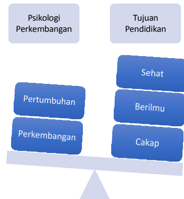
Gambar 2: Landasan Psikologi Perkembangan

pembelajaran pendidik dituntut untuk mampu menjadikan peserta didik manusia yang sehat dalam pertumbuhannya, berilmu dalam perkembangannya dan cakap dalam perbuatannya. Sebagaimana gambar konstruk teoritik tujuan pendidikan berlandaskan psikologi perkembangan di bawah ini